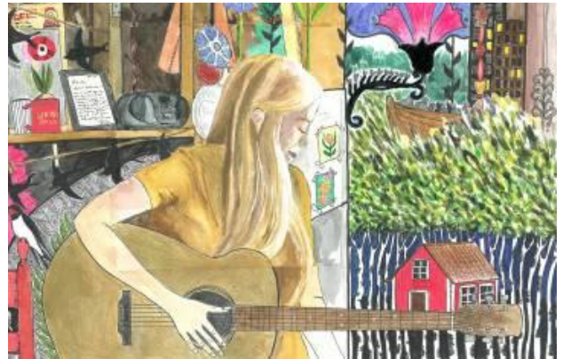
Le Silo – 1, rue du Pont de Boigny – Méréville Tél. : 01 64 95 00 98

Repas possible sur place avant le concert