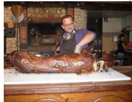
Le soir autour d'un cochon grillé à la Ferme de Lorris