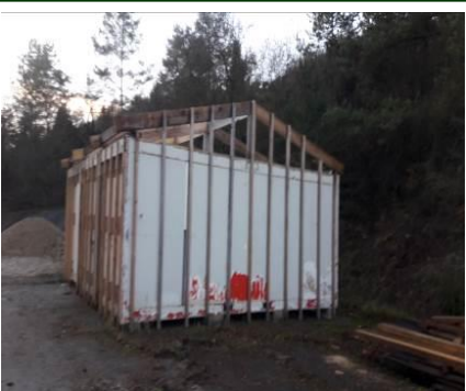
Un Algeco pour le club ado