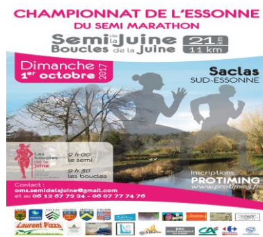
Magnifiques courses du Sud Essonne