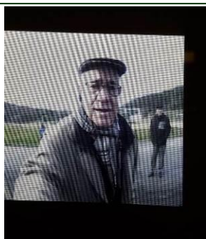
Sécurité : Un visiophone installé À l'école