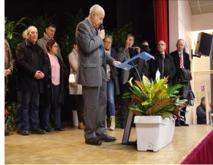
Vœux du Maire