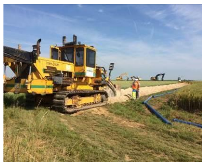
Travaux d'interconnexion eau potable Guillerval/Saclas/Monnerville