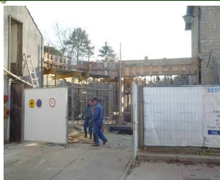
La Mairie en construction