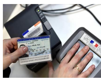
Le Dispositif de recueil pour titres d'identité arrive à Saclas