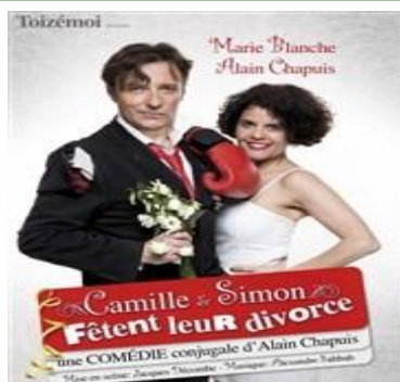
Le rire à l'honneur !