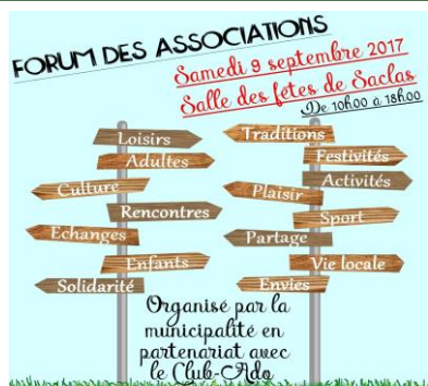
Le tissu associatif bien représenté