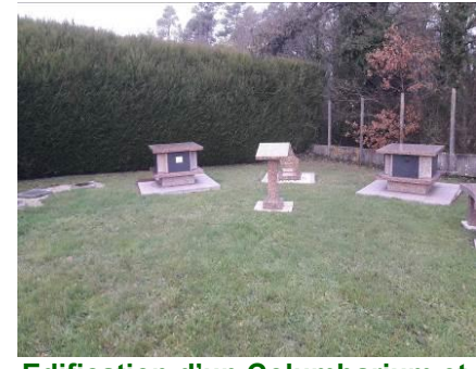
Edification d'un Columbarium et jardin du souvenir