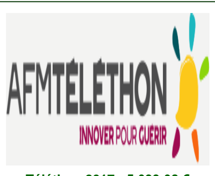
Téléthon 2017 : 5 099,08 € collectés