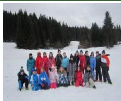
Séjour des CM1 & CM2 dans le Jura