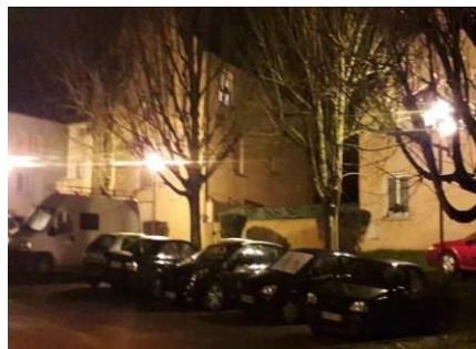
Rénovation de l'éclairage du Hameau de Grenet