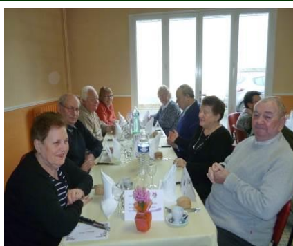
8 janvier Repas annuel du nos Aînés