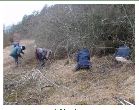
4 février Chantier Natura 2000