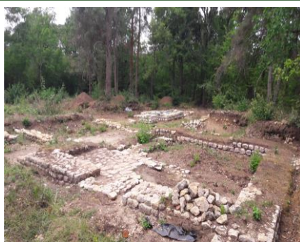
Site Gallo-Romain : Reprise des fouilles