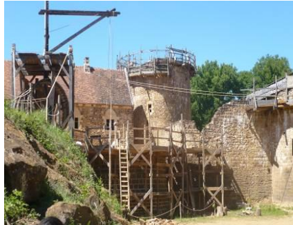
Les seniors en sortie au Château de Guedelon