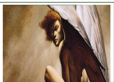
Eglise St Germain concert chœur et orchestres les musiciens d'Ose