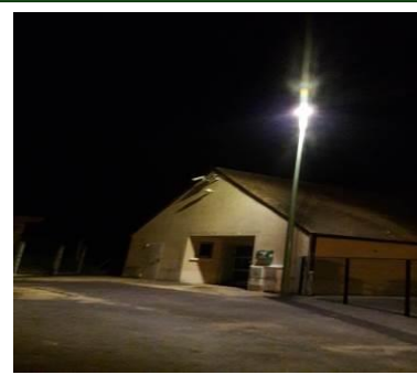
Sécurité : installation d'un réverbère à l'école