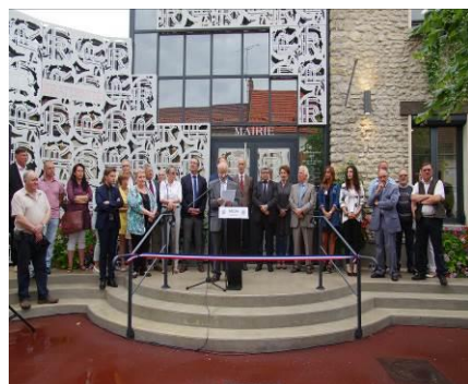
La Mairie inaugurée