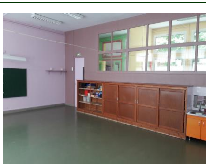
Rénovation de 2 classes par les services techniques