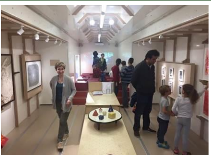
Culture : Première invitation du Musée Mobile à l'école