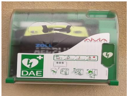
Acquisition de deux défibrillateurs cardiaques