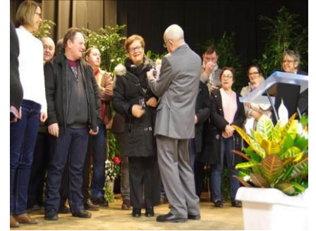
Remise des médailles Vœux du Maire