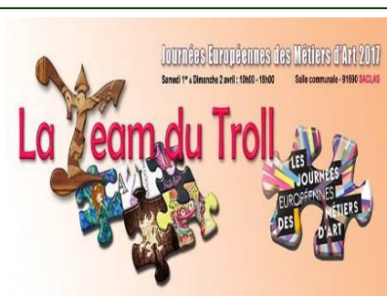
1 ère exposition de la team du TROLL