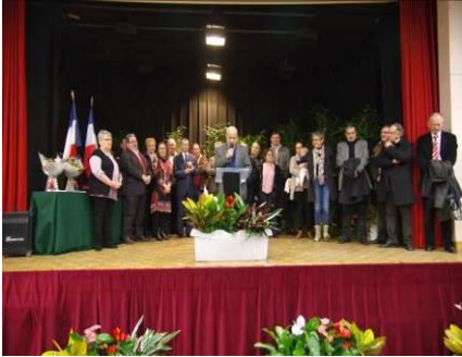
7 janvier Vœux du Maire