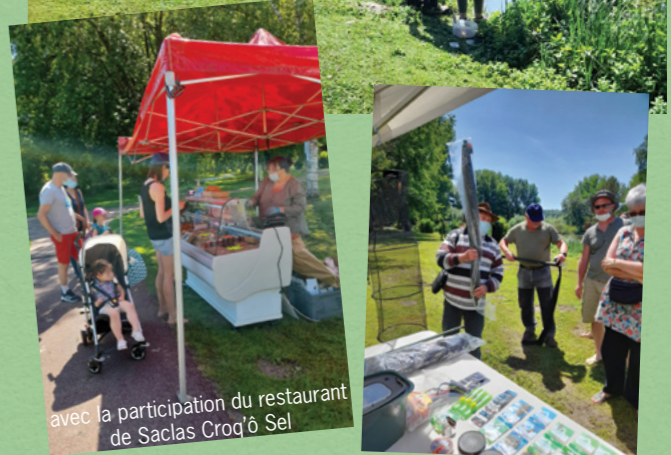
avec la participation du restaurant de Saclas Croq'ô Sel