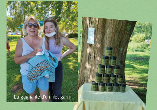
La gagnante d'un filet garni

Des animations autour de la pêche étaient organisées par l'association «Animation Gauloise de Saclas» le dimanche 13 juin , toute la journée autour du plan d'eau. Au programme concours de pêche, animations pour les petits, initiation à la pêche, ... Deux filets généreusement garnis par les commerçants de Saclas ont été gagnés. L'association les remercie chaleureusement pour leur générosité.