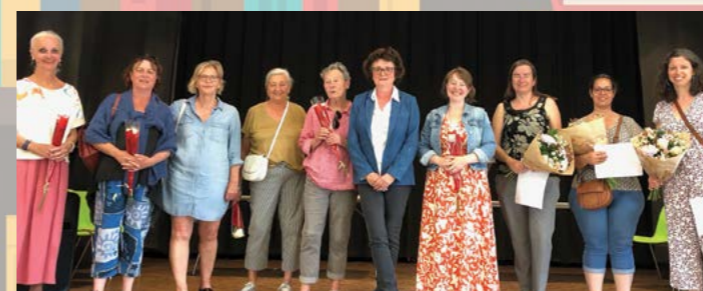
L'équipe de remise des prix : bénévoles de Salioclitae, membres du jury et institutrices