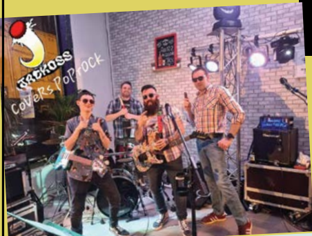
Concert avec «Les Jackoss»