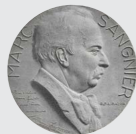
Marc SANGNIER (1873-1950) Né à Paris en 1873. Fondateur de la revue «le Sillon», il oriente dès le début du siècle les grands courants démocrates d'inspiration chrétienne. Il se consacre au rapprochement des peuples et à la formation des jeunes et crée en France les auberges de la jeunesse (1929). Résistant, il est arrêté par la gestapo en 1944.