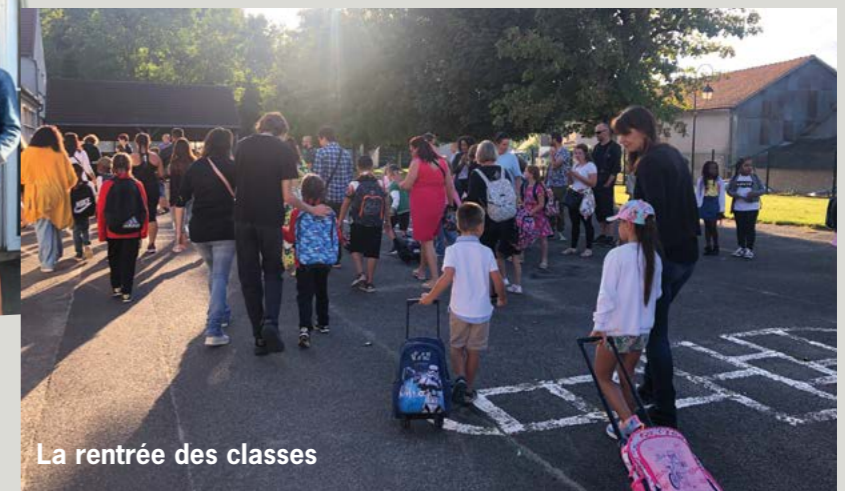
La rentrée des classes