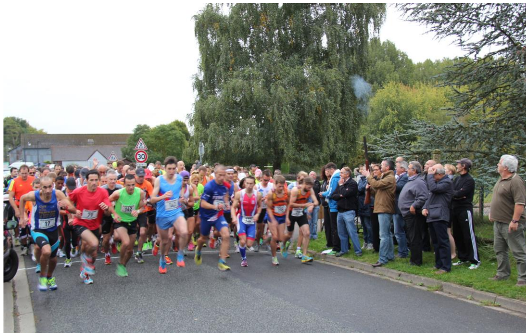
Départ des Boucles de la Juine 2016

CHAMPIONNAT DE L'ESSONNE DU SEMI MARATHON