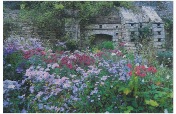
Entrée libre (pas de chiens svp) 21 rue de Gittonville 91690 SACLAS

Dans le cadre des secrets de jardins en Essonne qui auront lieu les 7 & 8 octobre 2017 le jardin d'Igor et Tamara ouvre ses portes de 14h à 18h chants Russes à 16h00