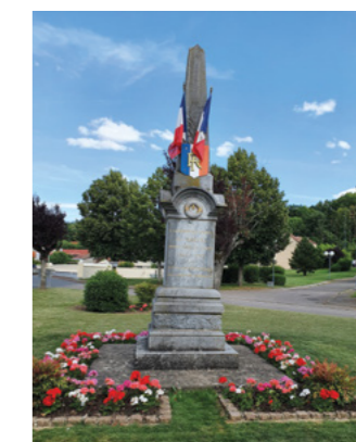
Fleurissement du monument aux morts par les services techniques.